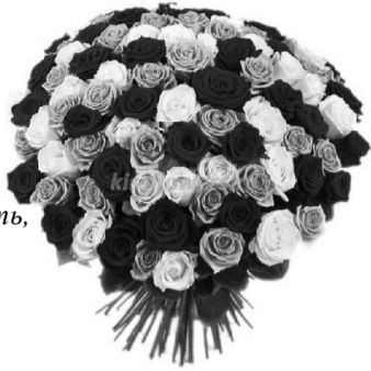
С любовью муж и дети.

Встреть его как можно веселей! Ты его с улыбкой в дом пусти, Об ушедшем лете не грусти, Годы? Ну какая тут беда, Если ты душою молода? Детям ты дорогу в жизнь дала – Значит жизнь не даром прожила, Значит, можешь с радостью дружить, Ни о чем на свете не тужить. Счастья тебе, солнца и добра, Светлых дней и летнего тепла, Исполнения солнечной мечты, Бодрости, здоровья, красоты.